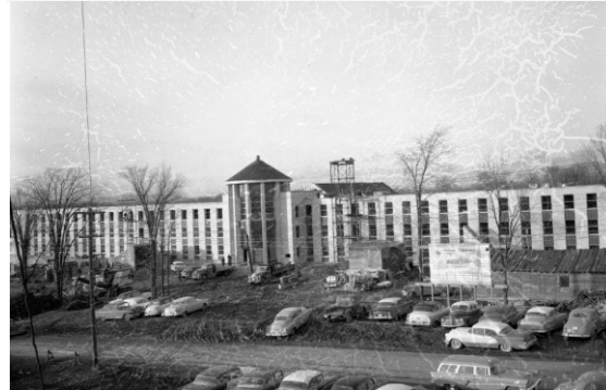
Le Grand Séminaire d'Ottawa en construction, en 1956.

Après des emplacements temporaires, l'e Grand séminaire l'édifice de 1957 a été construit dans une optique plus prudente, réaliste et minimaliste que son imposant bâtiment précédent.